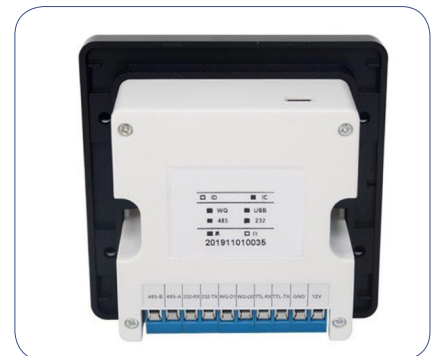
Wiegand 26/34, RS485, RS23-2